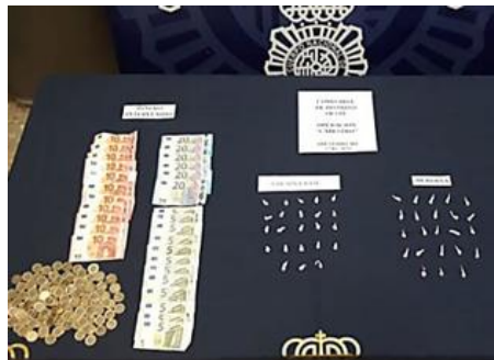
Seis detenidos por ocupar un piso en Málaga para vender droga