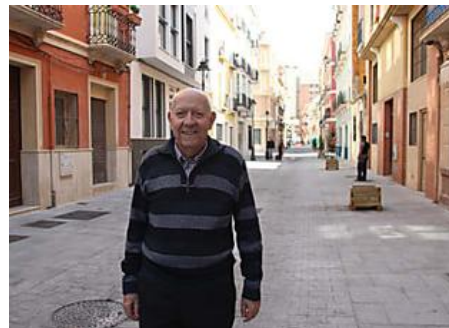
El Perchel pide peatonalizar calle Cuarteles