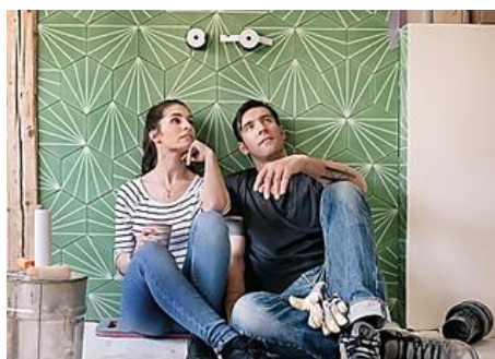
Abre la puerta a una nueva historia y estrena piso desde 50.000 €