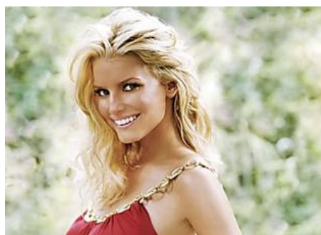
¡Se les fue de las manos! Modelos y famosas que ahora son talla XXL