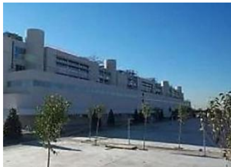
Detenida una pareja por fingir ser los padres de una recién nacida en Madrid