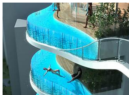
20 hoteles increíbles que existen realmente (13 de ellos te van a dejar estupefacto)